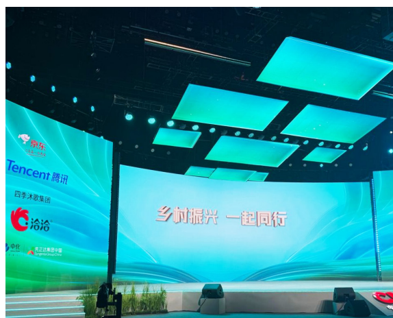
乡村振兴年度盛会现场