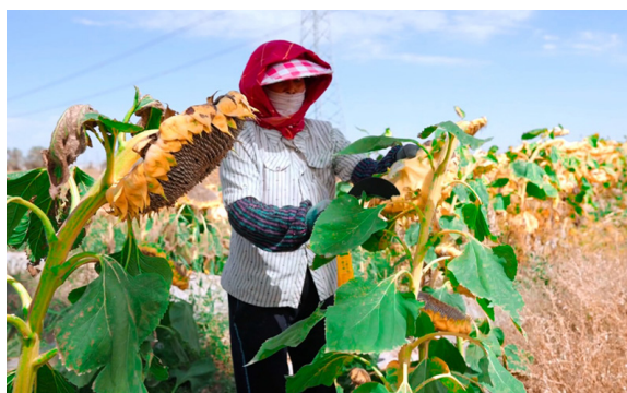
农户正在收割向日葵

早在2020年,洽洽就荣获了国务院扶贫办授予全国“万企帮万村”精准扶贫行动先进企业称号。未来,洽洽将进一步深化全产业链布局,以科技创新驱动产业升级,让乡村振兴战略在洽洽产业链上落地开花,持续为农业高质高效、乡村宜居宜业、农民富裕富足注能。