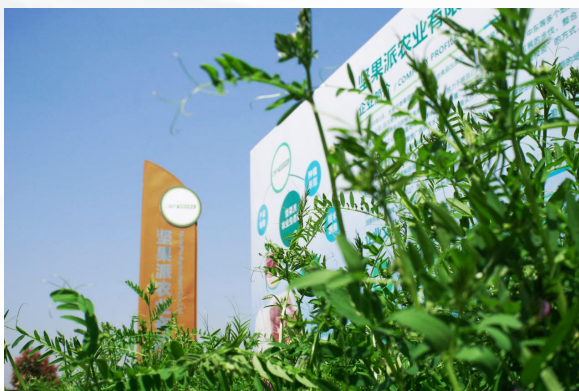
洽洽坚果派农业种植有限公司

14000亩)、开心果等,通过基地的建设,积极引导当地种植农业结构的调整,通过种植技术的输出,保证坚果种植的回收,提高农民收入。据不完全统计,每年带动当地村集体收入增长近一千万元。“产业造血”,助力当地村民增收,让坚果产业成为助力乡村振兴的一抹亮色。